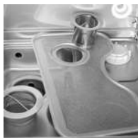
Différents filtres présents dans la cuve de lavage