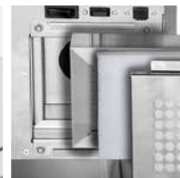
Filtre HEPA H14 et préfiltre