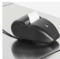
Imprimante externe connectée par câble ( en option)