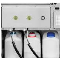
Réservoirs de produits chimiques