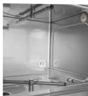
Cuve de lavage avec bras de lavage