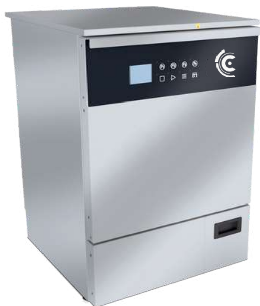
AWD655-8XR-LAB Séchoir avec porte acier inoxydable

Parfait pour être utilisé comme dernier cycle de séchage ou comme séchage supplémentaire pour garantir une verrerie parfaitement sèche dans toutes ses parties, à la fois à l'intérieur et à l'extérieur !