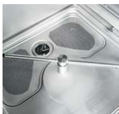
Cuve de lavage avec bras de lavage