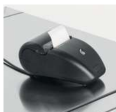
imprimante intégrée (en option)