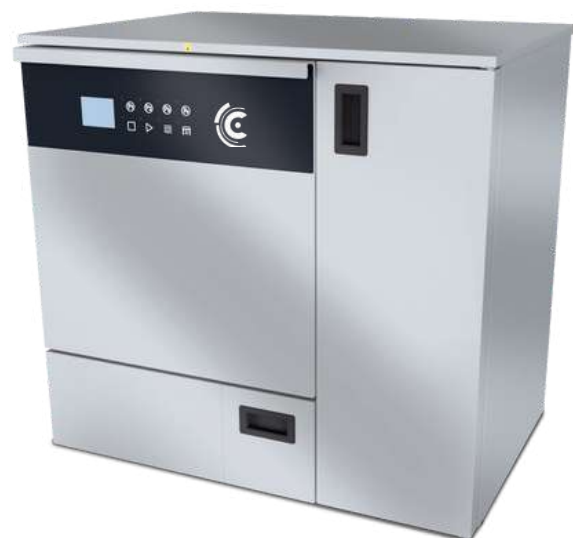
AWD655-8XL-LAB Porte en acier inoxydable avec séchage