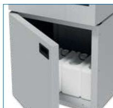
Support en acier inoxydable des réservoirs de produits chimiques