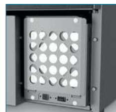
Filtre à Air