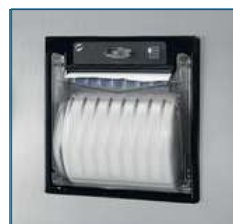
imprimante intégrée (en option)