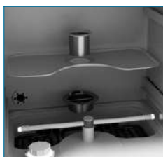
Différents filtres présents dans la cuve de lavage