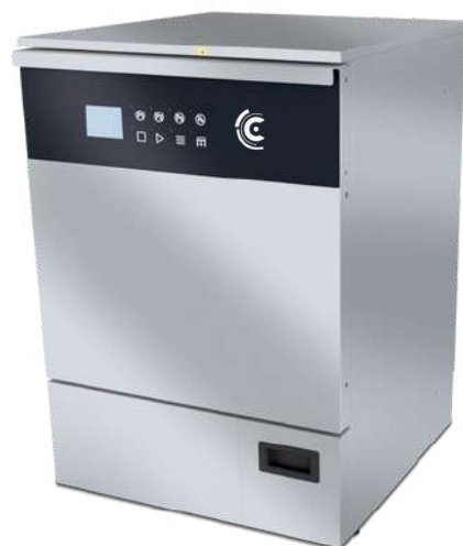
AWD655-8X-LAB Porte en acier inoxydable avec séchage