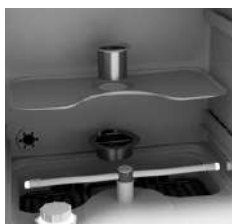
Différents filtres présents dans la cuve de lavage