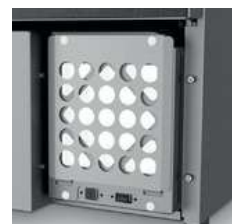
Filtre à Air