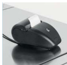
imprimante intégrée (en option)